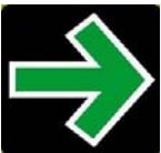
Tabelle: Fehlverhalten beim Rechtsabbiegen mit Grünpfeil.