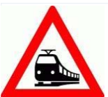
Tabelle: Fehlverhalten an Bahnübergängen.