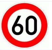
Tabelle: Allgemeine Tatbestände zum Thema Geschwindigkeit.