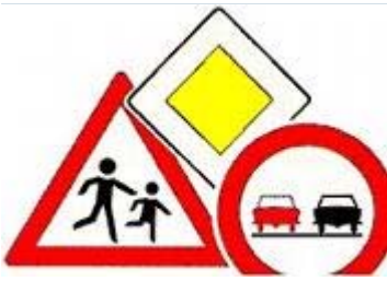
Collage von Verkehrszeichen

Auszug aus dem Bußgeld- und Punktekatalog (Stand: 01. Februar 2009)