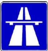
Tabelle: Die wichtigsten Tatbestände im Bezug auf Autobahnen und Kraftfahrtstraßen.