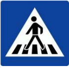
Tabelle: Fehlverhalten am Fußgängerüberweg.