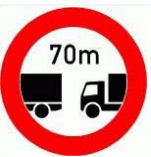
Tabelle: Nichteinhalten des Abstandes von einem vorausfahrenden Fahrzeug in Metern bei einer Geschwindigkeit von mehr als 80 km/h.

Die mit (*) gekennzeichneten Angaben treffen zu, wenn die gemessene Geschwindigkeit mehr als 100 km/h beträgt.