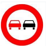
Tabelle: Rechtswidriges Überholen.